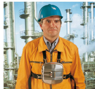
SSR 30/100 B